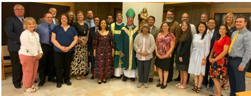
Clase del 2024 | Retiro de Preordenación | Centro de Retiros de San Benedicto

Hay una cantidad infinita de trabajo que se lleva a cabo detrás de escena para las esposas de aquellos ordenados o que están en proceso de ser ordenados diáconos. Su formación