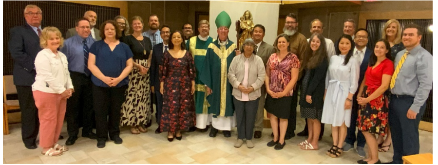
Deacon Class 2024 | Pre-Ordination Retreat | St. Benedict’s Retreat Center

There is an infinite amount of work that goes on behind the scenes for the wives of those ordained or soon-to-be ordained. Their formation and discernment are essential as