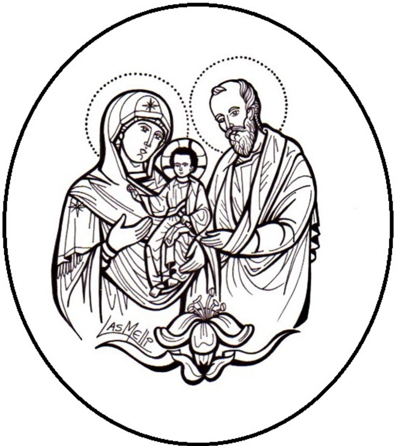
La Sagrada Familia