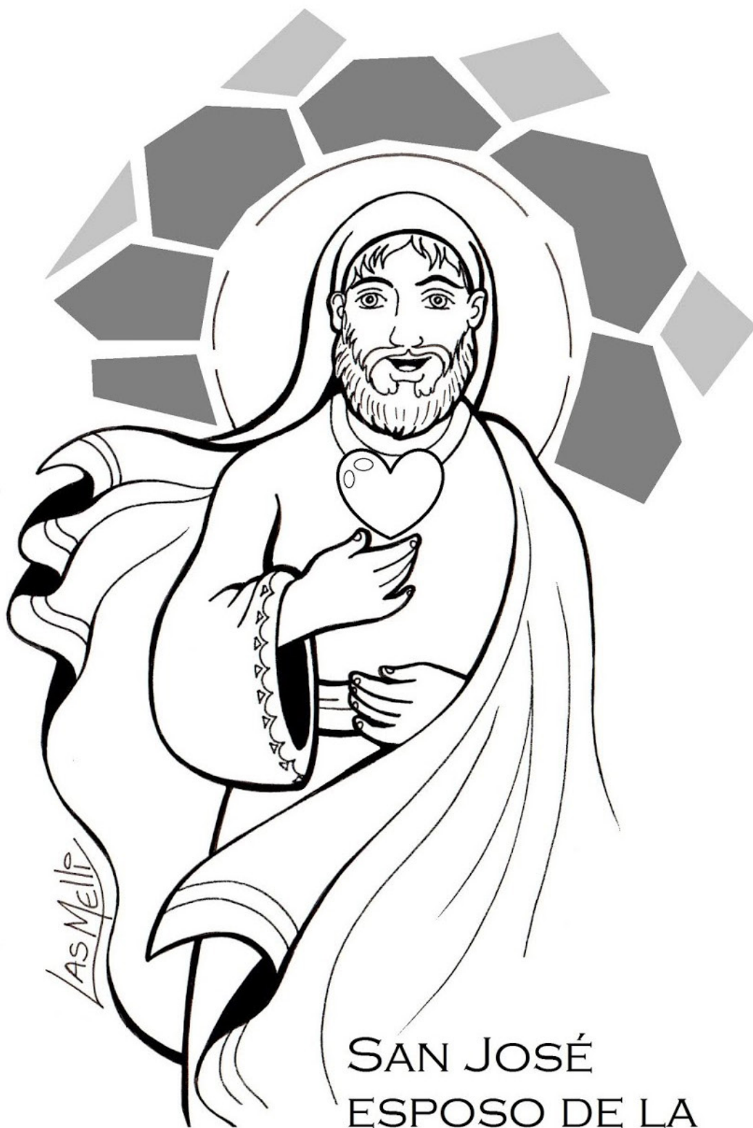
SAN JOSÉ ESPOSO DE LA VIRGEN MARÍA